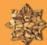
výlisky z řepky