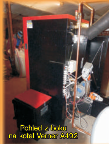
Pohled z boku na kotel Verner A492