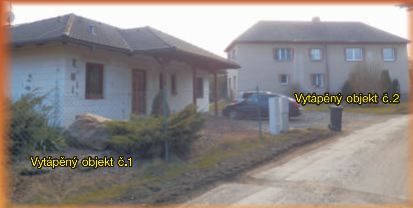
Vytápěný objekt č.2

SERVISÁK ROKU 2010 NEJLEPŠÍ PRODEJCE ROKU 2017 NEJLEPŠÍ PRODEJCE ROKU 2018