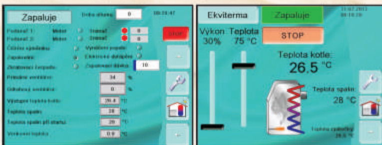
Dotykové obrazovky regulace kotlů Verner A602