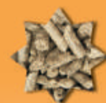
výlisky ze slunečnice