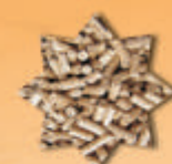
pelety z řepky