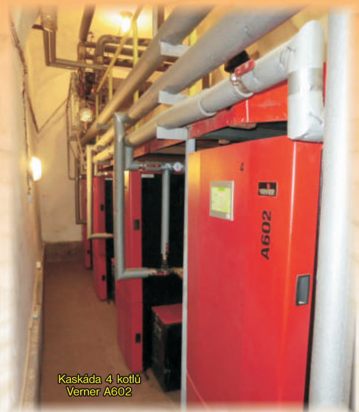
Kaskáda 4 kotlů Verner A602