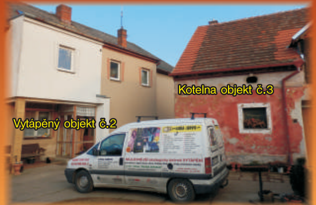
Kotelna objekt č.3