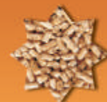
dřevní pelety s kůrou