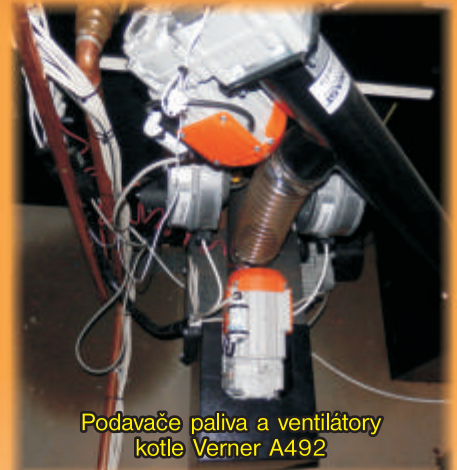
Podavače paliva a ventilátory kotle Verner A492