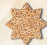
pšenice žito ječmen triticále olejníky pokrutiny